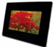
Cadre photo numérique