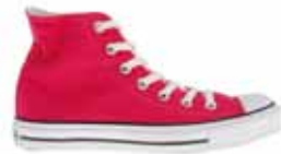
Paire de Converse hautes (H)/(F)